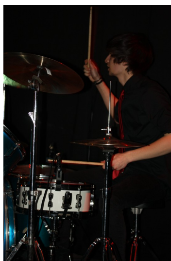
Sweet Mad Wolf