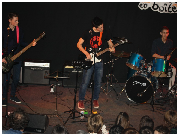
The Plugged Chicken

Merci à tous ceux qui nous ont permis d'organiser cette rencontre musicale.