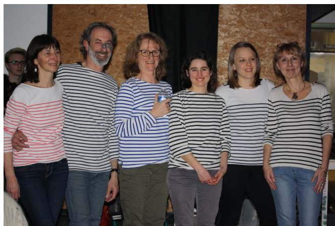
Des organisateurs heureux !!!!!